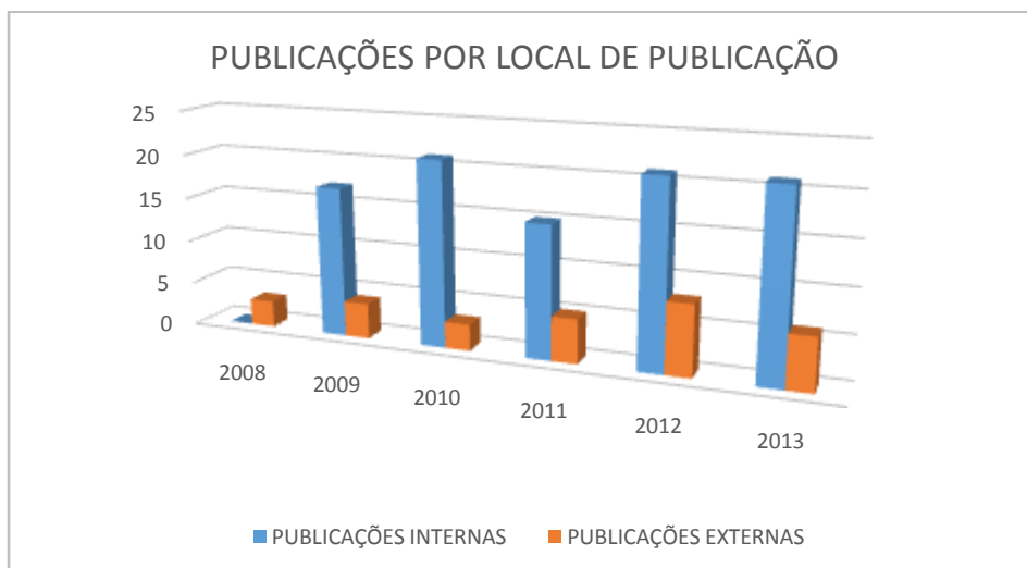
Gráfico 2: Publicações por Local de Publicação.

Desta forma, podemos observar a importância da criação de instrumentos de publicação interna, ou seja, a criação de anais para o evento anual do curso, bem como a criação da revista científica do curso, como fatores de fomento para que os acadêmicos pudessem produzir mais material científico. A partir destes números, é importante tratar sobre os temas relacionados à produção científica, desta forma, se mapeou as temáticas abordadas dentro dos seguintes eixos: História Regional e Local, História Política, História, memória e oralidades e, outras temáticas. Essas temáticas foram as que, dentro da pesquisa história, mais foram encontradas nas publicações científicas do curso.