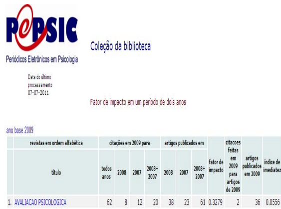
Figura 4 - Fator de impacto de um periódico.

Conclusão: Iniciado em 2005 com cinco títulos, o Portal de Periódicos Eletrônicos PePSIC teve um crescimento exponencial nestes 8 anos de existência conforme mostra a tabela a seguir.