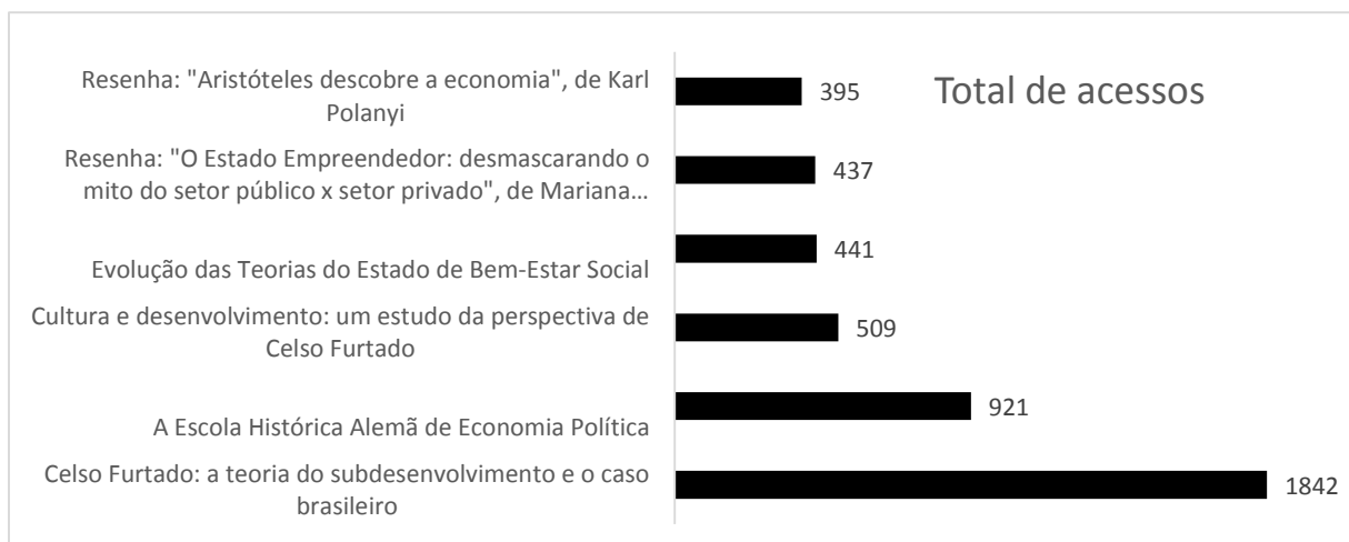
Gráfico 2 – Textos mais acessados na versão online da revista Multiface.

Relatórios retirados do sistema OJS apontam um tempo médio de avaliação de 27,41 dias entre a submissão e a conclusão de uma etapa de avaliação (seja a aceitação do artigo ou emissão do parecer pelo membro do conselho editorial). Os textos mais acessados na versão online da revista são da área de Economia, conforme é possível verificar no gráfico 2: