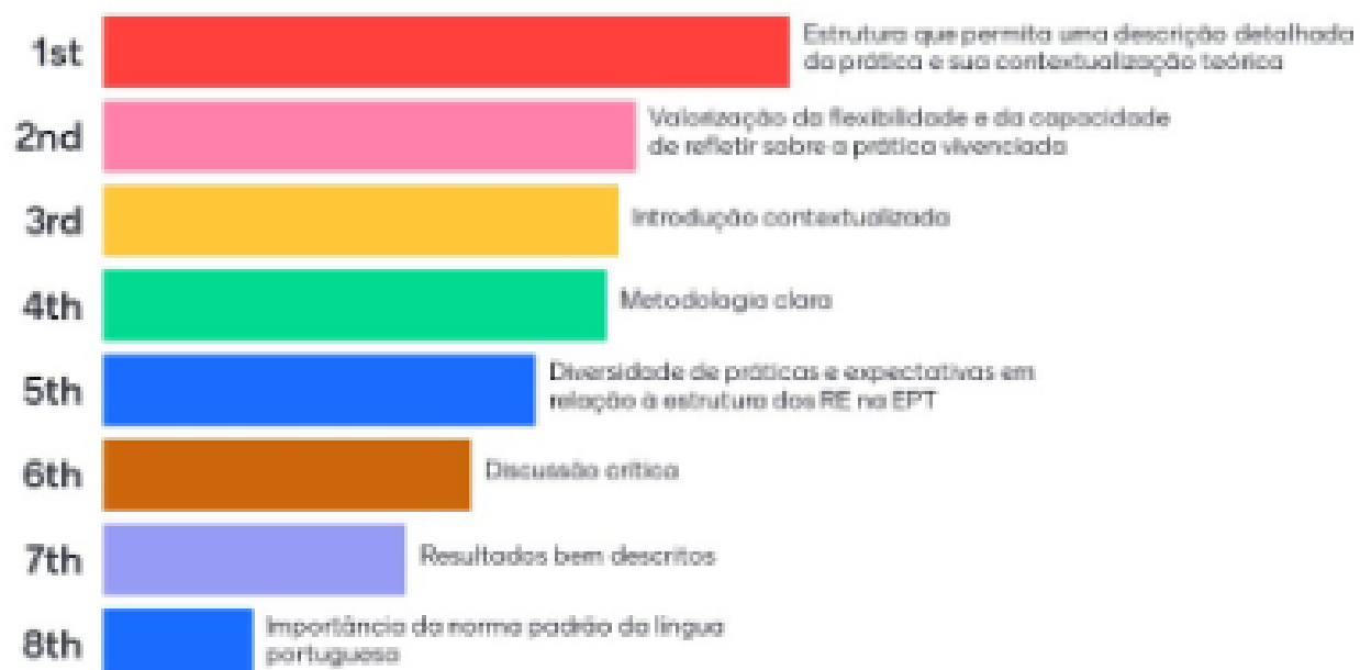
Figura 4 - Em relação ao formato, o que considera relevante apresentar em um RE da EPT?